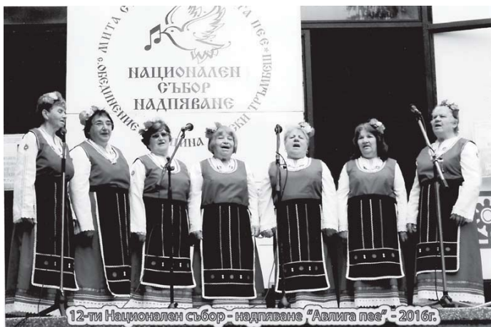
12-ти Национален събор - надпяване "Авлига пее" - 2016г.

Над 320 певчески групи с над 3000 участници от страната се надпяваха три дни на 12-ия събор „Авлига пее“. За поредна година наши певци се представиха отлично в големия събор-надпяване в Обединение, родното село на певцата Мита Стойчева.