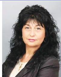
За да пребъде Лясковец! Честит празник!

Бъдете здрави, винаги смели и решителни в постъпките си. Нека оставим своя забележима следа в достойния път на нашия град.