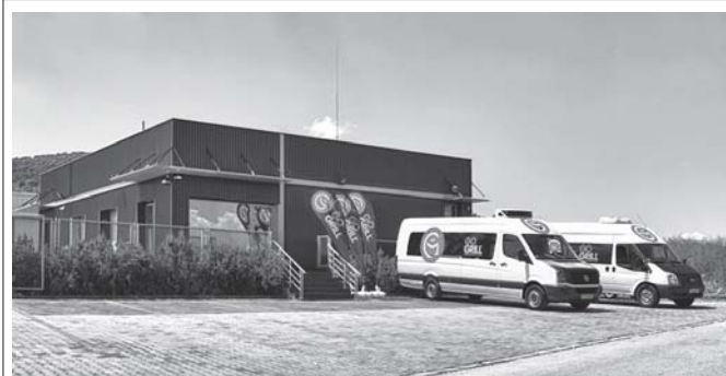
Дружеството е създадено преди пет години и за този период налага концепция в храненето, при която съчетава типично българската традиция и модерното виждане, усещане и отношение към храната, като реализира и ам-