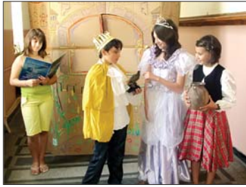
тел на годишната награда за постижения в областта на природните науки. Получава награда за първо място в тази област.